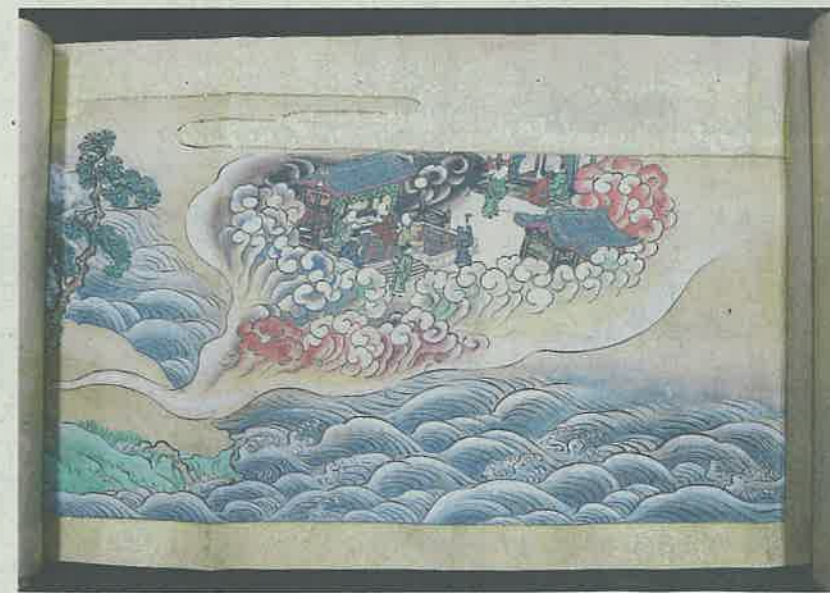
御伽草子「蓬萊山」に描かれた空中に浮かぶような島