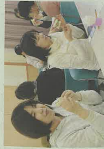
作ったサバサンドを試食する参加者