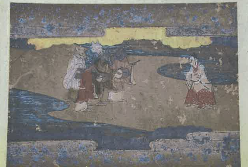
御伽草子「御曹司島渡」は馬人の島も描かれている