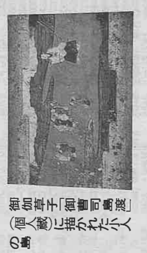
御伽草子「御曹司島渡」 (個人蔵)に描かれた小人 の島

しらせ 南極へ出港 第61次隊 南極観測船「しらせ」が12 日、第61次の観測隊員や物資 を南極に運ぶため、東京・晴 海客船ターミナルを出港した。 第61次隊の構成は、夏隊42 人と越冬隊29人の計71人。他 人に高校教員や共同通信記者ら 7人も同行し、大半はしらせ で昭和基地に向かう。71人の うち東京海洋大の「海丸丸」 で海洋観測をする隊員や、南 極基地から西に約600km離 れたゼールロント山地に