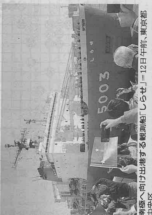
南極へ向け出港する観測船「しらせ」=12日午前、東京都 中央区

実習生失踪減へ 新たな対策公表 出入国在留管理庁 出入国在留管理庁は12日、 外国人技能実習生の失踪を減 らすため、新たに対策を強化 する方針を公表した。大量に 失踪者を出した実習生や監視 団体は適正に実習ができこ ないとなし、新規受け入れ を停止させる。失踪者が少数 でも、実習先に賃金支払にな ないとなし、新規受け入れ 断など林野関係が656億 円、水産関係が115億円だ った。 受け入れできなくなる。 全ての監視団体を対象に 入管庁は対策についての周知 文書を出し、協力を呼び掛け る。森野正法相は閣議後の記 者会見で「施策を着実に執行 どの違法性が認められれば、 でも、実習先に賃金支払にな ないとなし、新規受け入れ 断など林野関係が656億 円、水産関係が115億円だ った。