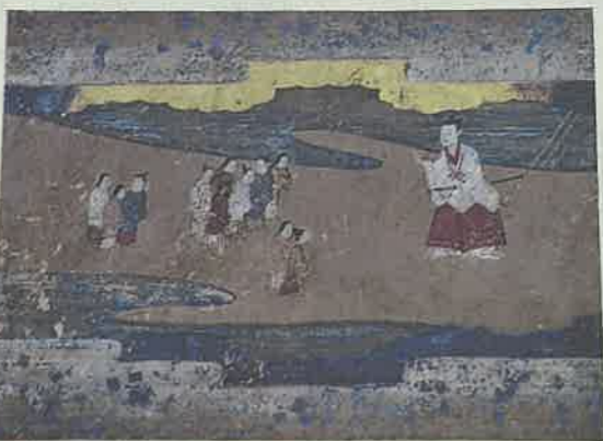
御伽草子「御曹司島渡」(個人蔵)に描かれた小人の島

イフトは1689年、駐オランダ英国大使を務めたテンプルの秘書になった。同教授は「スウィフトには日本との接点が多すぎた」と考えられており、東インド会社経由でもたらされた日本の情報を得ていたとする説は以前からある」と指摘する。 石川教授は、「『御曹司島渡』など御伽草子の絵巻が、興味深い。欧米注目のテーマ」 武田将明(東京大学)は「御伽草子以外に、明確に作品を挙げて日本文学の影響を指摘した研究は今までにな