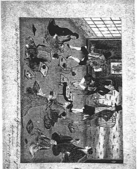
「長崎屋宴会図」(神田外語大付属図書館蔵)